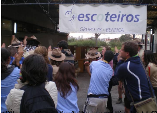
El día 7 de abril los scouts del Clan Kilimanjaro en una reunión con los scouts de Benfica en el campamento de la semana santa.