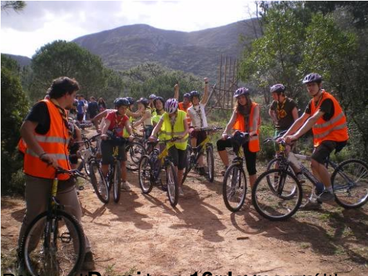
El grupo de ciclismo del Clan Kilimanjaro en un momento de la salida del día 6 hasta el campamento de la semana santa.

Lunes 07 de Abril de 2008 23:45 - Última actualización Martes 08 de Abril de 2008 00:46